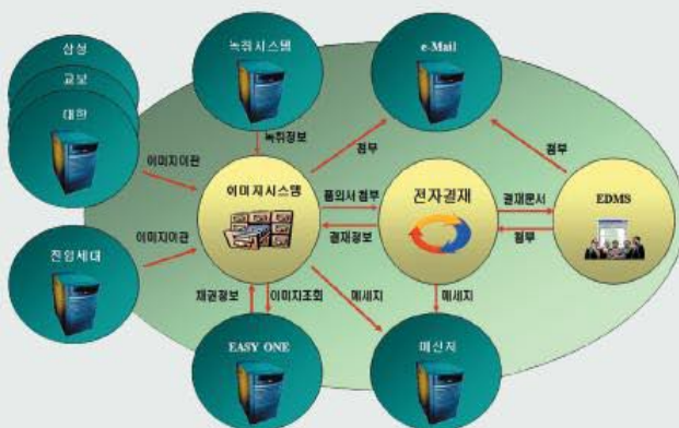
전자 결재 시스템의 흐름도

우리의 성공사례는 동종업계에서 높은 관심을 갖고 벤치마킹을 하고 있는 상태다. 우선 아이온커뮤니케이션을 선택한 중요한 이유 중 하나가 국산 솔루션이라는 것에 있다. 우리는 자체적 시스템을 구축해 사용하고 있기 때문에 외산에 영향을 받지 않는 엔진이 가장 필요했다. 비용이 다른 컨설팅사보다 다소 비싸긴 했지만 1년이 지난 현재까지 단 한번의 프로세스 멈춤이나 이상 현상은 없었다.