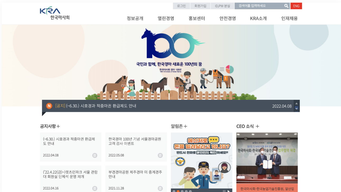
[한국 마사회 공식 홈페이지]

아이온커뮤니케이션즈의 WCMS 솔루션인 ICS를 바탕으로 한국마사회 차세대 경마/마필 시스템 구축하였습니다.