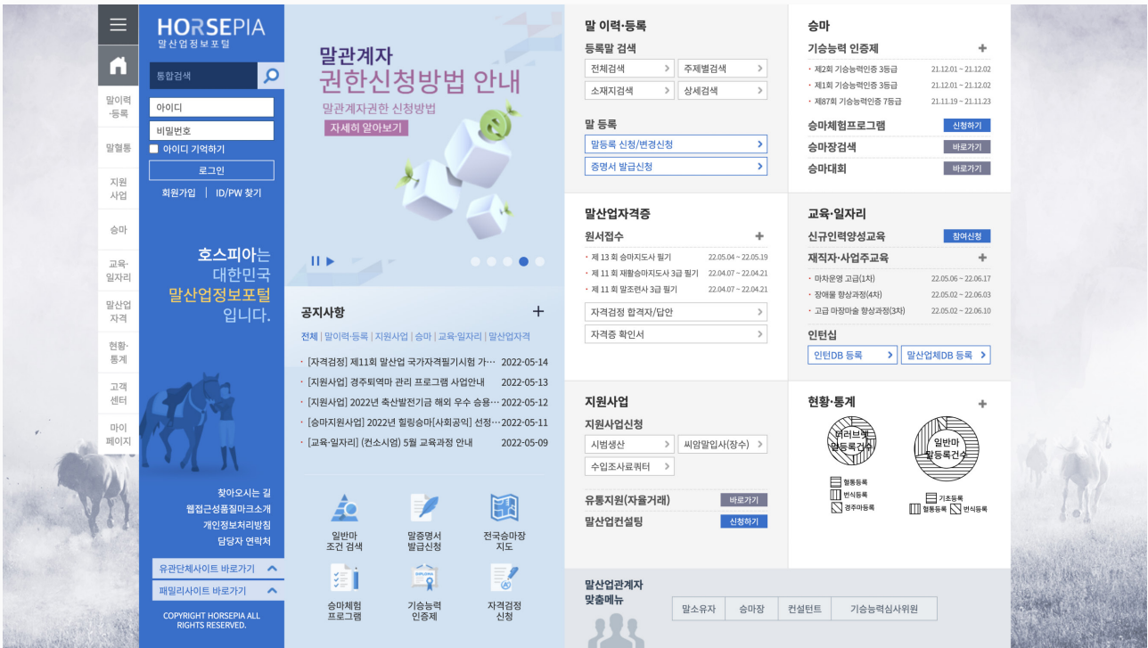
[마사회-호스피아 메인 페이지]

한국마사회의 지역 경마장별(서울, 부경, 제주) 시스템 개별 운영으로 인한 사용자 및 운영/유지보수 불편과 모바일 기능이 구현되지 않아 현장 업무 지원이 불가능했습니다. ICS를 도입하여 하나의 콘텐츠 생성 시 관리하는 모든 사이트에서 반응형 콘텐츠(PC/모바일)로 제작이 가능하게 되었습니다.