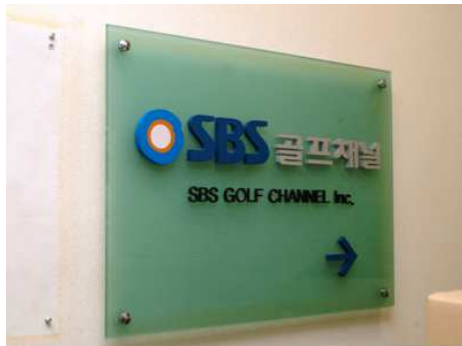
SBS 미디어넷이 운영하는 SBS 골프채널

SBS 골프채널은 2005년 10월 내부 조직 개편과 함께 웹사이트의 리뉴얼 작업을 했다. 웹사이트를 개편하면서 당시, 하나의 정형화된 틀을 도입해 내부 콘텐츠를 관리하자는 요구가 제기됐다. 기존에 프로그래머들이 이슈가 발생할 때 마다 수작업으로 일일이 사이트를 개발, 수정해야 했는데, 이러한 작업없이 관리자가 직접 솔루션을 이용해 웹 사이트의 콘텐츠 관리를 하고자 했던 것이다.