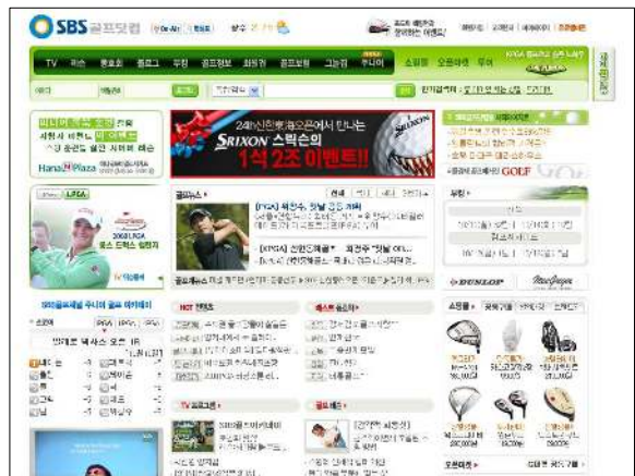
IWS(I-ON Web Analytics Server) v1.0'을 도입한 SBS 골프채널 홈페이지

의 IWS(I-ON Web Analytics Server) v1.0'을 도입하기로 최종 결정했다.