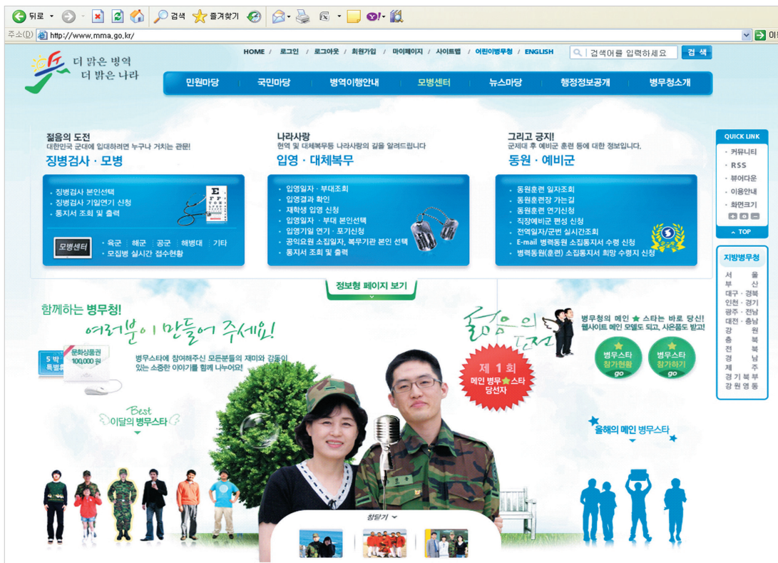
병무청 홈페이지 www.mma.go.kr

병무청은 지난해 말 CMS와 검색엔진, 로그분석 솔루션이 통합된 IWS(I-ON Web Analytics Server)를 도입해 홈페이지를 재구축, 성공적이라는 평가를 듣고 있다. 그 이유가 무엇인지 현장을 직접 찾아가 봤다. 김소연 기자 soy@itdaily.kr